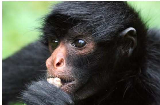
Singe araignée (portrait)