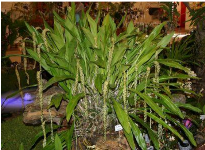
Dendrochilum filiformis , présenté par Reinhart Orchideeën, Champion de l'exposition, Gretz-Armainvilliers 2012

L'exposition de Pringy ne dérogera pas à cette tradition. Un jugement sera réalisé par l'Ecole des Juges d'Orchidées (EJO) de la Société Nationale d'Horticulture de France (SNHF). Deux prix seront attribués aux professionnels, l'un pour la plus belle espèce botanique, l'autre pour le plus bel hybride. Dans les mêmes conditions, deux autres prix seront attribués aux amateurs. Enfin la plante ayant obtenu la note la plus élevée recevra la distinction de Championne de l'exposition. De plus des médailles d'or, d'argent et de bronze récompenseront les plantes ayant obtenu les plus hautes notes.