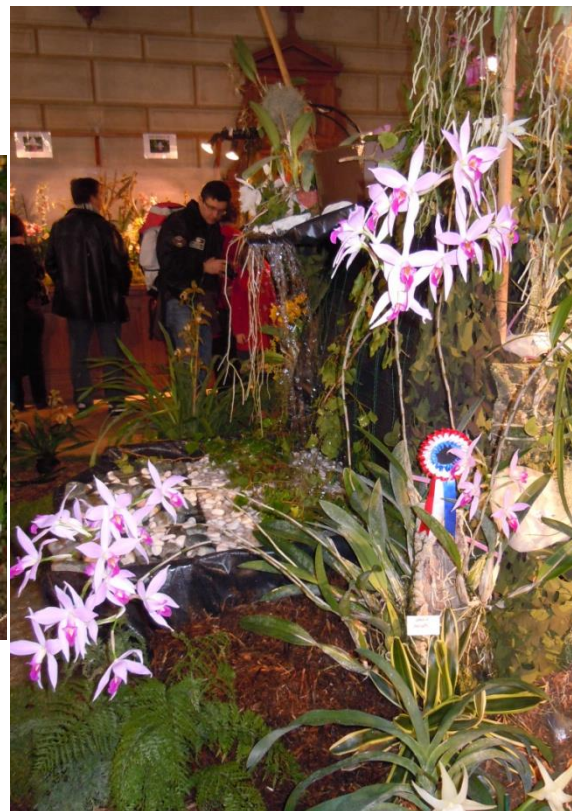
Laelia anceps , présenté par AM Orchidées, Champion de l'exposition, Paris 2012