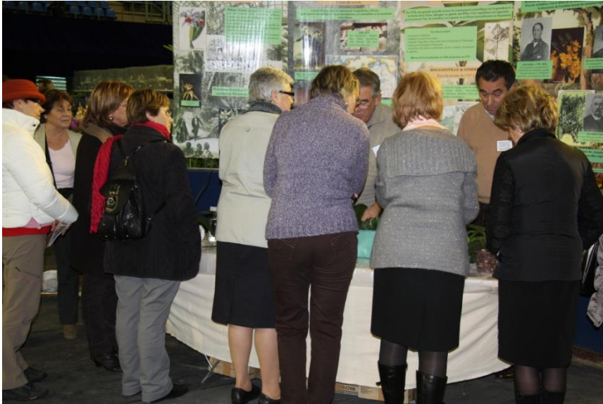
Les démonstrations de rempotage sont toujours suivies attentivement par les visiteurs

Les experts d'Orchidée 77, présents pendant l'exposition, se tiendront à la disposition des visiteurs pour répondre aux questions sur la culture des orchidées. Les visiteurs pourront apporter leurs plantes. Un diagnostic sur l'état de la plante sera effectué, des conseils seront prodigués et la plante sera rempotée si cela s'avère nécessaire.