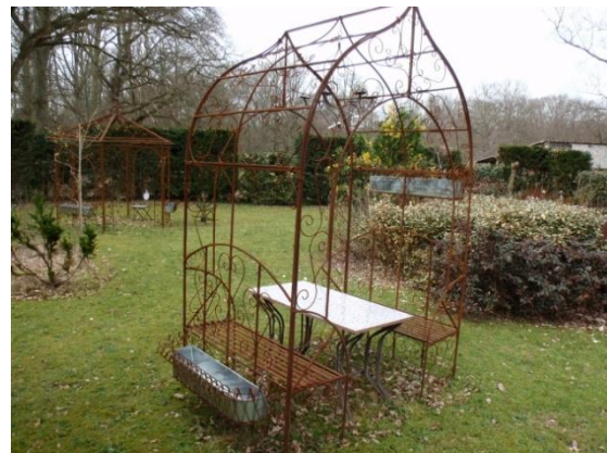
Ferronnerie d'art proposée par les Pépinière du Bois Joli