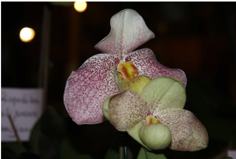
Paphiopedilum emersonianum x P. hangianum . 1er prix Exposition de Pringy 2011