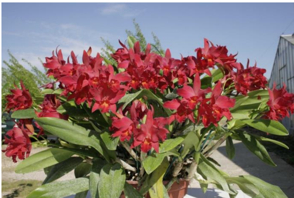
Sophrolaeliocattleya Jewel Box 'Sheherazade' en culture dans les serres d'A.M. Orchidées