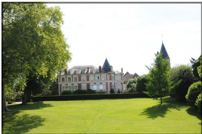
La mairie et son parc

Toute la richesse d'une histoire qui fait partager l'ambiance éternelle d'une ville de province où l'on prend le temps de vivre.