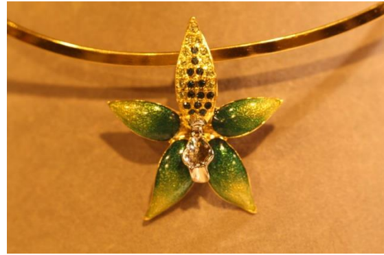
De véritables fleurs d'orchidées sont transformées en bijoux par Valérie Lavault